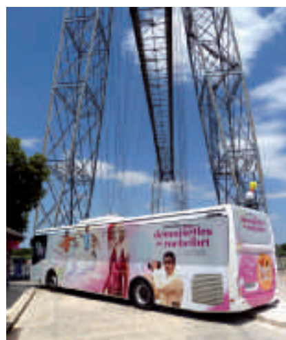
Le bus aux couleurs des Demoiselles circule quotidiennement sur le territoire de la Communauté d'Agglomération du Pays Rochefortais.